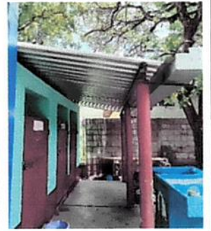
Foto 6: Instalación de estructura metálica y cambio de lámina por lamina troquelada.

Observación: Si es necesario se pueden agregar hojas adicionales y actualizar el número de hojas.