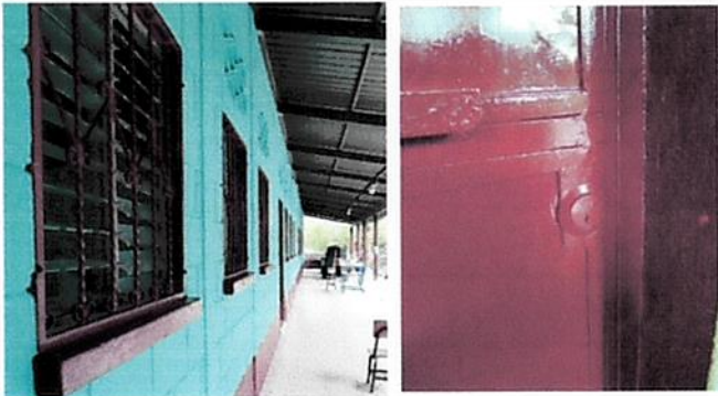
Foto1: Mantenimiento a balcones y puertas (lijado, pintado y cambio de chapas)