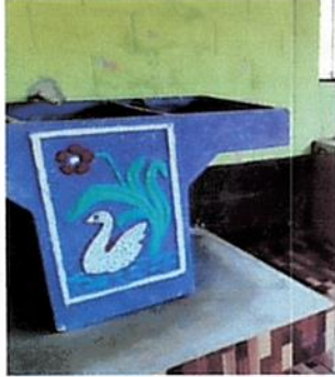
Foto 3: :Instalación de estufa rural, restauración de cableado eléctrico con sus Conductos, instalación de tomacorriente y sus lampara led ahorrador.