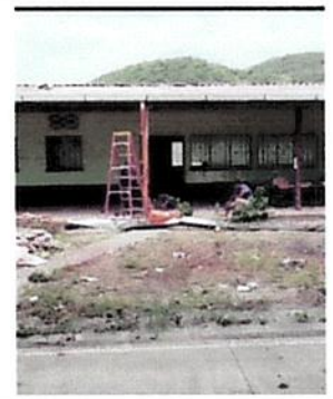
Foto 2: Pintado de muros de interior y exteriores de la escuela y sustitución de canal .